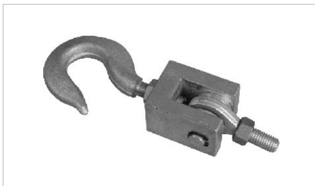
Монтажно-габаритные размеры мм (в дюймах)

Материал – сталь с никелевым покрытием. Применение – НЗ, ВЗГ, НЗГ, НЗФ, ВМЗ. Используется для строительства крановых, упаковочных, бункерных, цистерновых и др. весов.